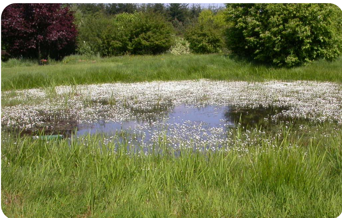
La mare de Frassem, une mardelle située près d'Arlon

Outre la restauration de 4 mardelles mentionnée ci-dessus, la MAE8 devrait permettre la mise en place d'un réseau de mares en milieu agricole pour reconnecter les quelques populations restantes et pour la plupart isolées (actuellement 7 agriculteurs se montrent intéressés pour une vingtaine de mares).