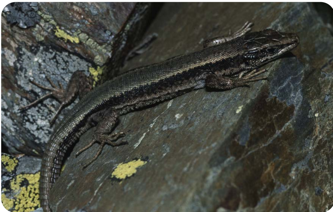
Iberolacerta bonnali , le lézard de Bonnal, une espèce classée "En danger" dans la Liste rouge nationale des reptiles de France métropolitaine

http://www.uicn.fr/Liste-rouge-France.html