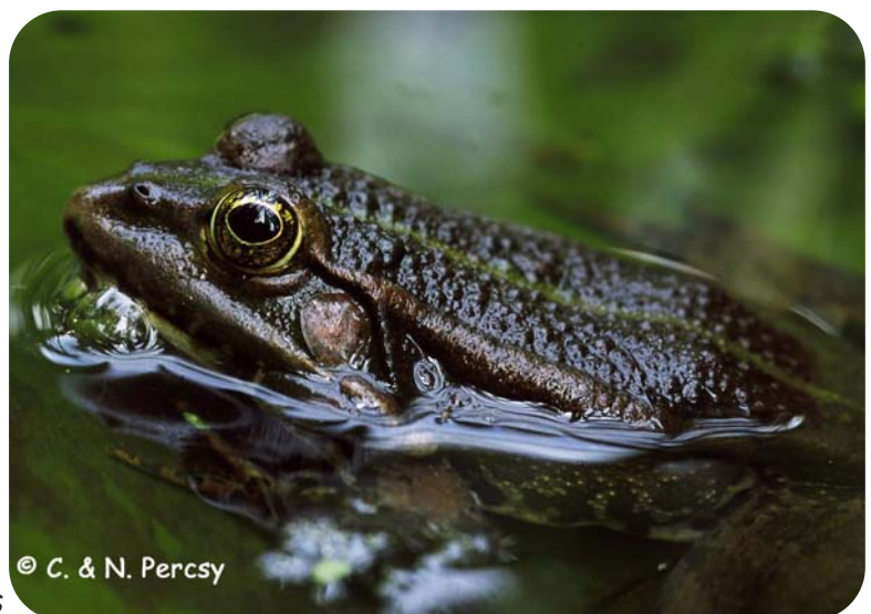
P kl. esculentus